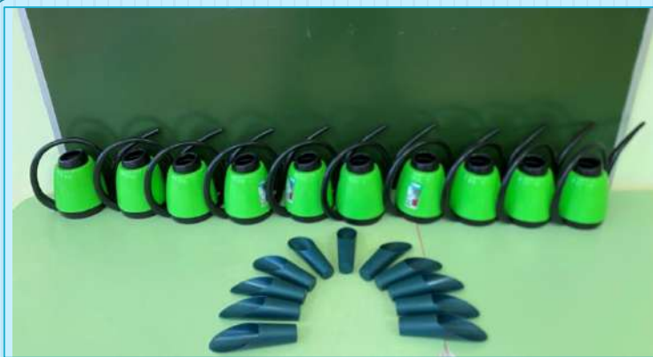
Набор леек и совков по количеству обучающихся