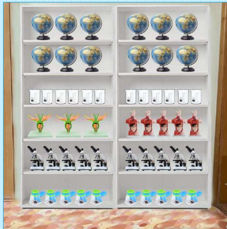
Большие, удобные для хранения, стеллажи с набором посуды для опытов и учебных пособий на каждого