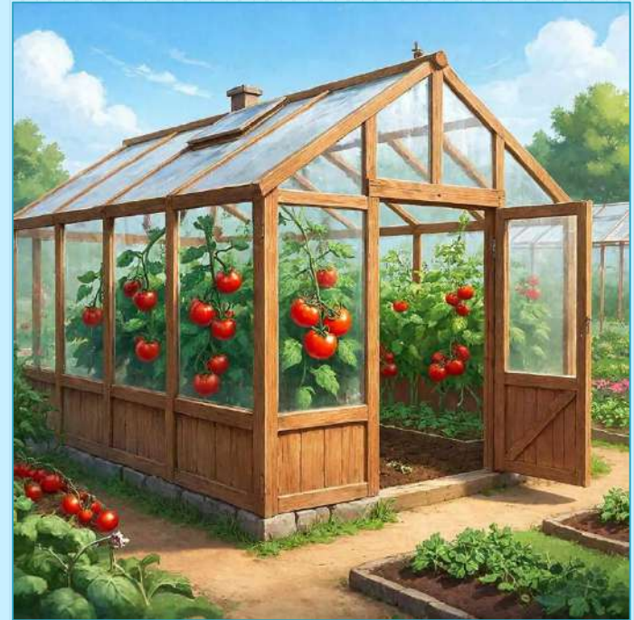
А сможем вот так!

Современной теплицы для наблюдения полного цикла выращивания овощных культур