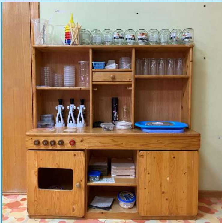
Небольшой шкаф с неспециализированной посудой и минимальным количеством пособий