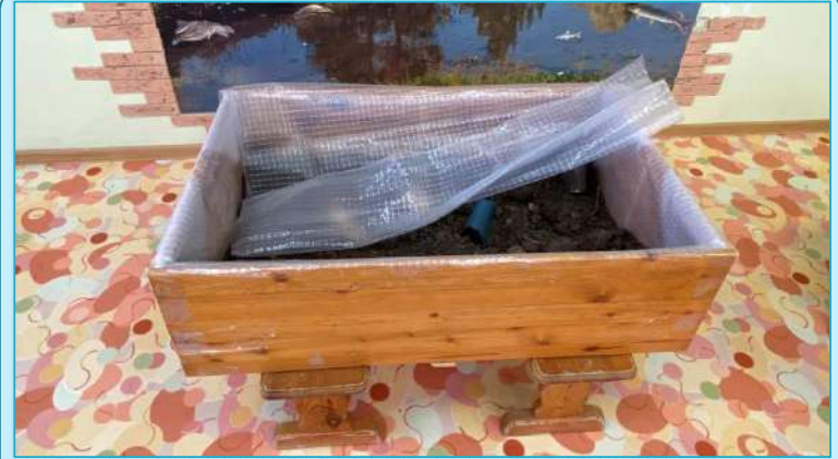
Контейнер для хранения большого объема грунта