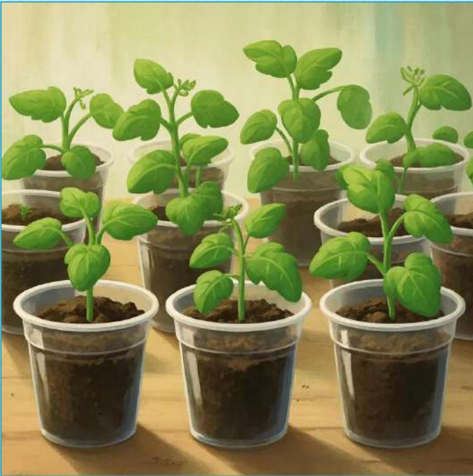
Сейчас выращиваем так