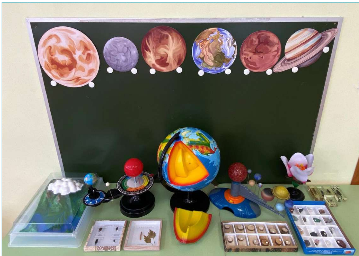
Набор демонстрационных пособий