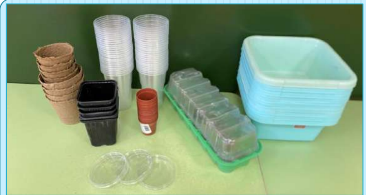
Набор ёмкостей для посадки