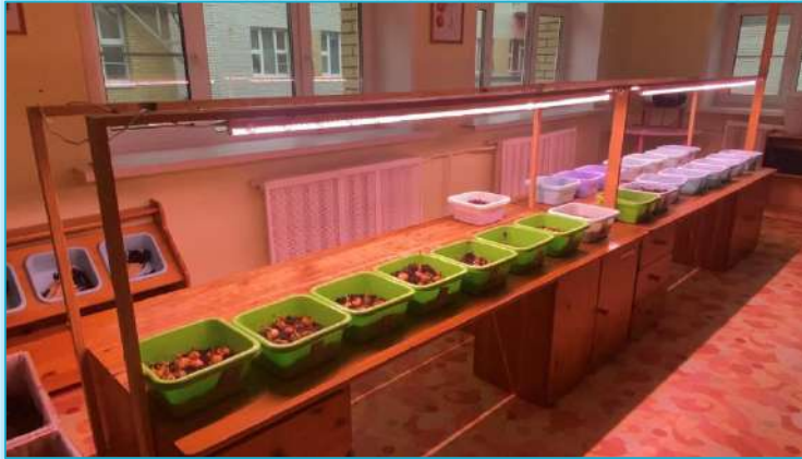
Стол для рассады, оснащенный фитосветильниками малой мощности