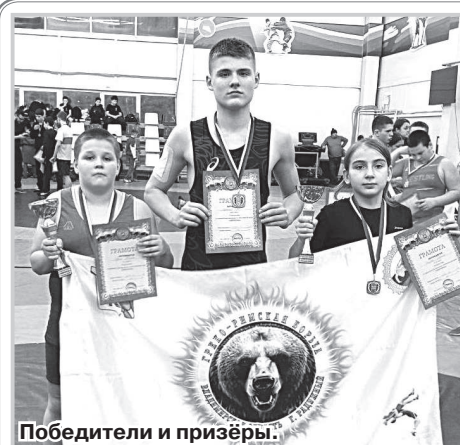
Победители и призёры.