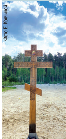
Поклонный крест, установленный рядом с местом, где будет возведен новый храм

Продолжается Петров пост. В этом году он начался 8 июня. Начало Петрова поста всегда приходится на понедельник, через неделю после праздника Троицы. Длиться он может от 8 до 42 дней. Заканчивается всегда 12 июля, в день памяти святых первоверховных апостолов Петра и Павла. В честь этого праздника пост и именуется Петровым или Апостольским. И в честь святых первоверховных апостолов Петра и Павла начато строительство храма в городе Радужном.