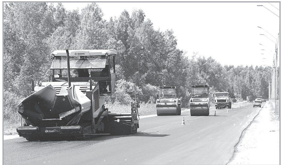
Работы по асфальтированию участка автодороги от офиса ЗАО «Электрон» до перекрёстка у жилого дома №1 первого квартала.