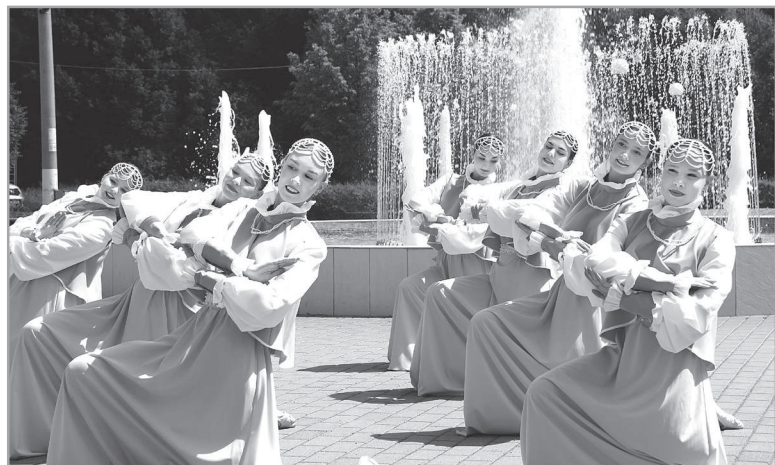
Участницы танцкласса «Родничок» исполняют танец «Волга».

В этот значимый для всей страны день свой первый основной до-