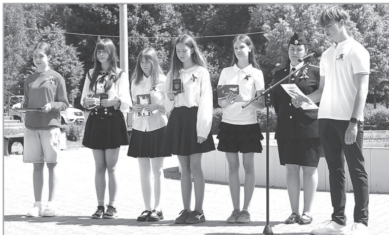
Получение паспорта гражданина РФ - важный момент!

понимает, что получение паспорта даёт ей не только определённые права, но и серьёзные обязанности. Желаем ей и её сверстникам быть достойными гражданами России!