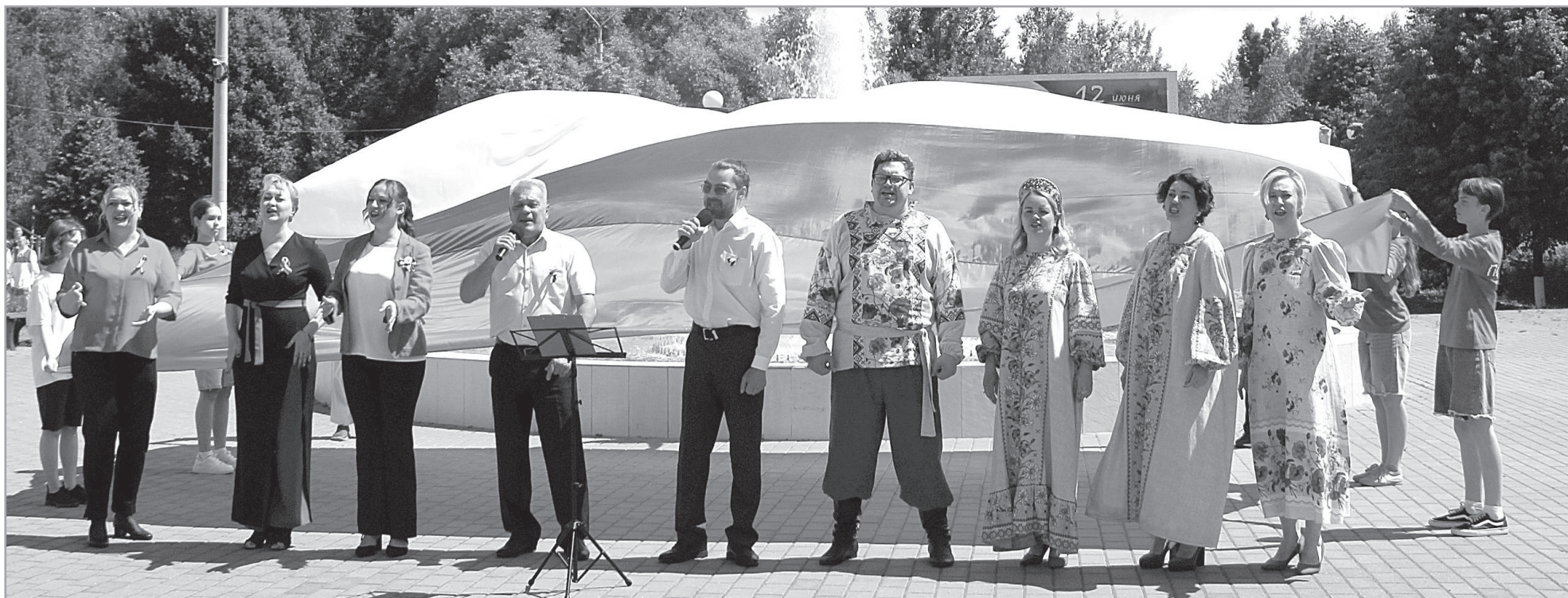
В финале праздника на площади у фонтана развернули шестиметровый триколор.