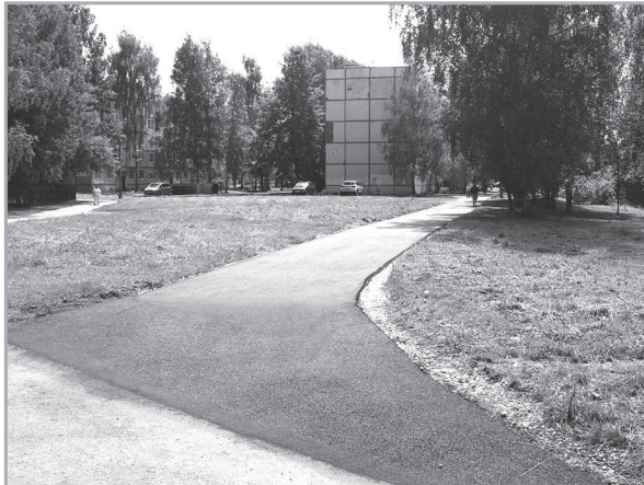
Участок пешеходной дорожки от второй школы до дома №12 первого квартала заасфальтирован.

Срок окончания работ - 20 июня, но всё уже сделано, осталось от-