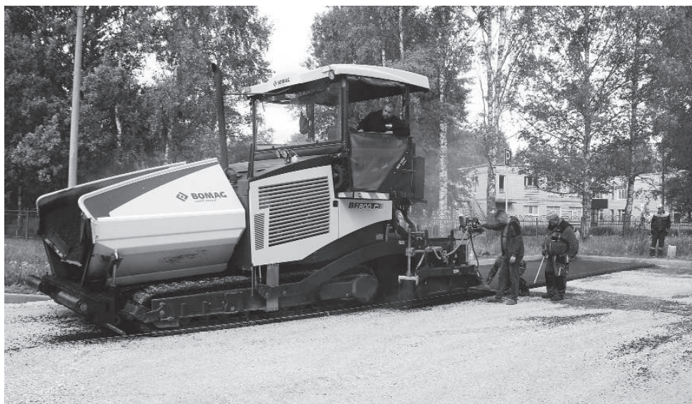
Работы по укладке асфальта с помощью спецтехники на площадке для парковки автомобилей у дома №12 первого квартала.

К стати, температура асфальтобетонной смеси при укладке должна составлять в среднем 120 градусов. И специалисты следят, чтобы она обязательно соответствовала норме при выполнении работ. Потому так жарко и дымно на улице, когда рядом идёт укладка асфальта.