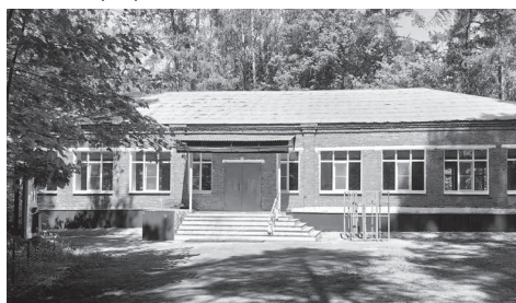
Здание столовой в лагере.