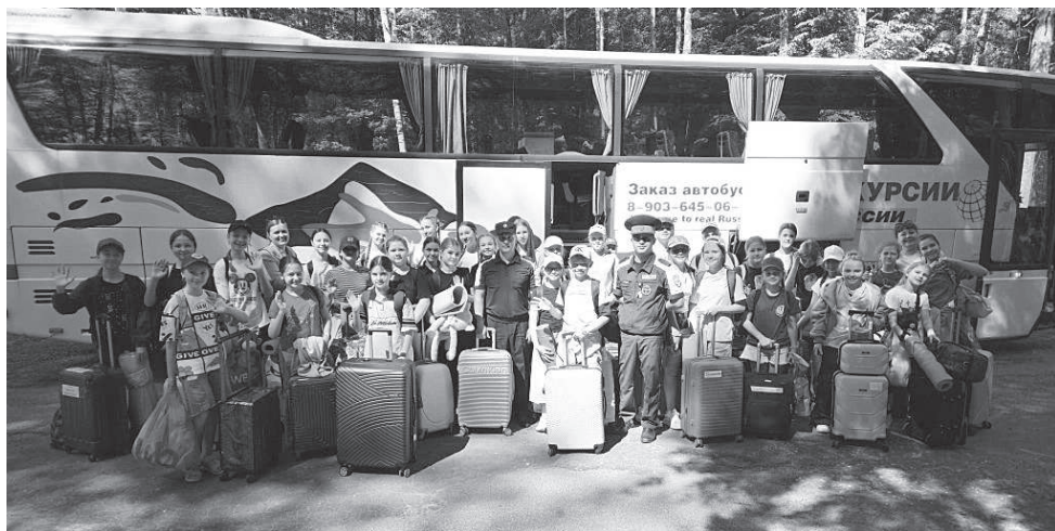
Участники первой смены с сопровождающими прибыли в лагерь.

Ну а представительницы женского движения партии «Единая Россия» во главе с его