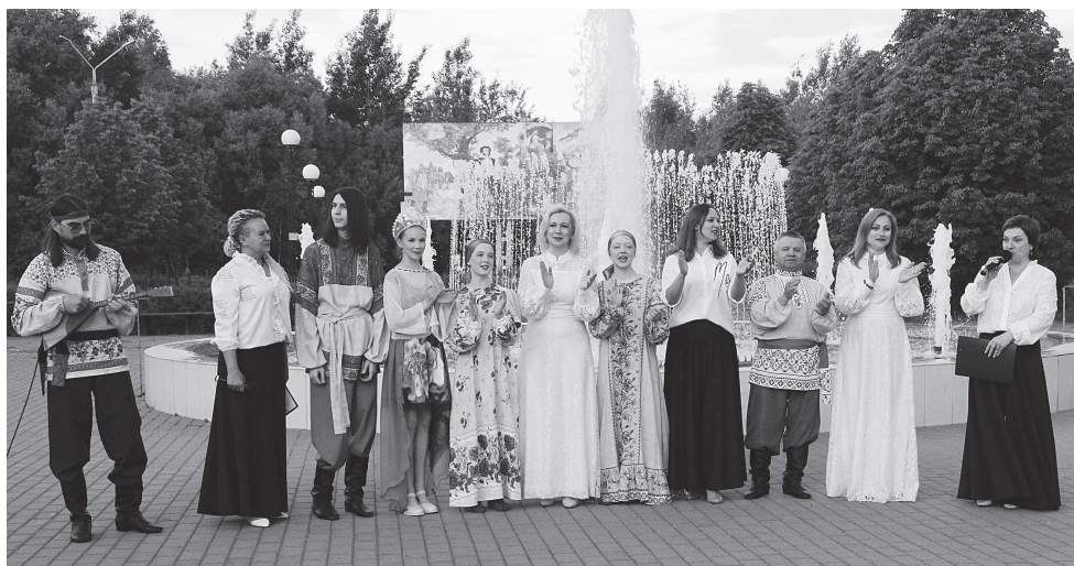
Первый летний вечер посвятили А.С. Пушкину.

В четверг, 4 июня в Радужном официально открылся новый сезон культурного проекта «Летние вечера у фонтана» от молодёжного спортивно-досугового центра «Отражение». Третий по счёту, этот проект уже успел завоевать сердца зрителей и с нетерпением ожидался публикой.