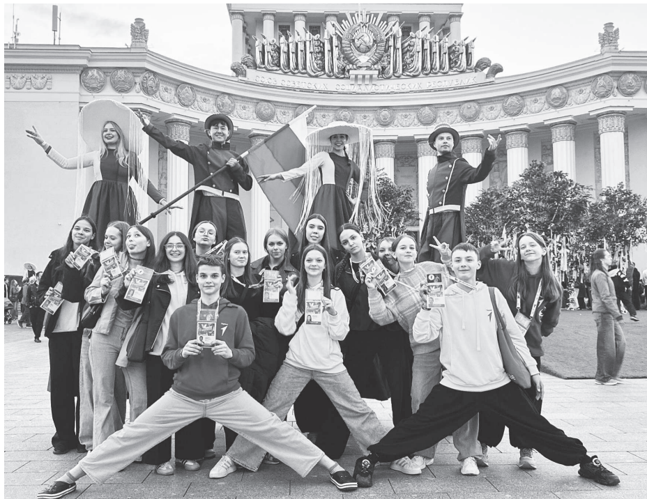
Участники V Международного фестиваля детства и юности Движения Первых.

Е.Н. Ромашечкина. Фото предоставлено автором.