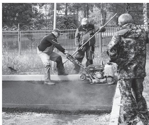
Выполнение работ по асфальтированию.