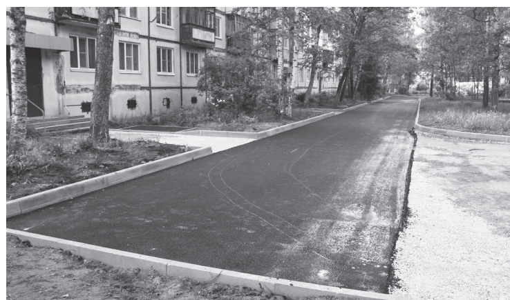
У дома №12А первого квартала уложен новый асфальт.