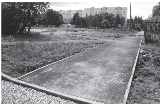
Пешеходная дорожка ко второй школе от дома №12 первого квартала.