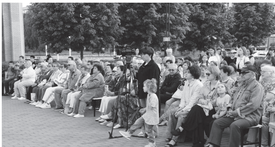
Старт нового сезона прошёл с аншлагом.

Е. Малиновская. Фото предоставлено МСДЦ.