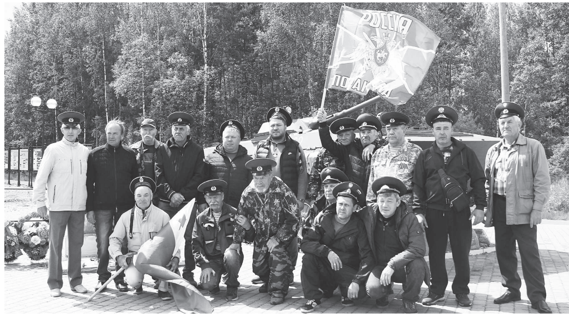
Ветераны-пограничники на торжественном митинге.

После завершения официальной церемонии ветераны пограничной службы фотографировались на память, общались и вспоминали годы службы.