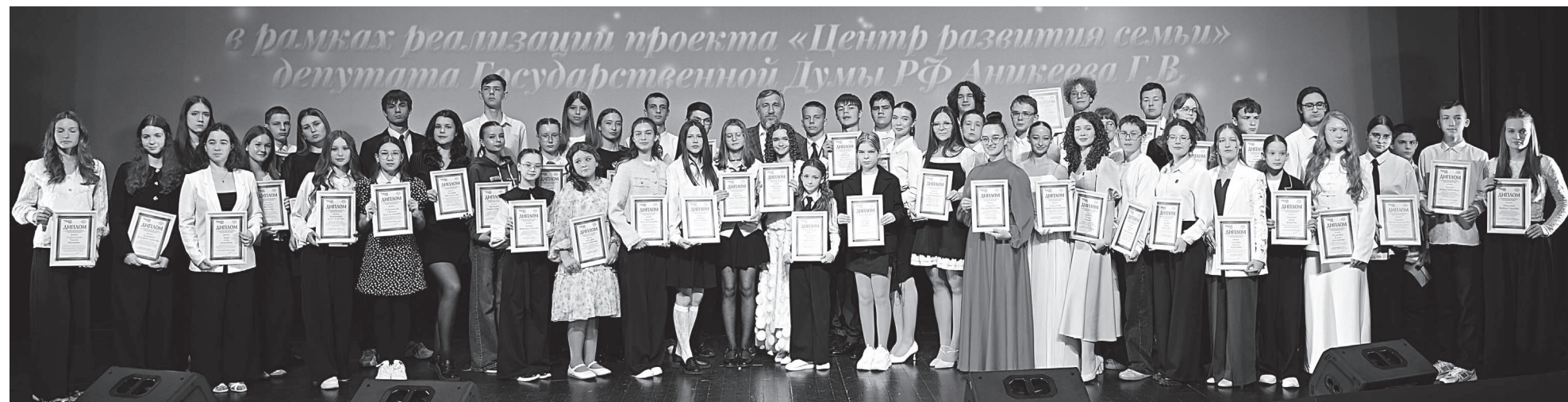
В рамках проекта депутата Госдумы Григория Аникеева «Центр развития семьи» заслуженную награду получили 55 одарённых ребят.

Пресс-служба «Милосердие и порядок».