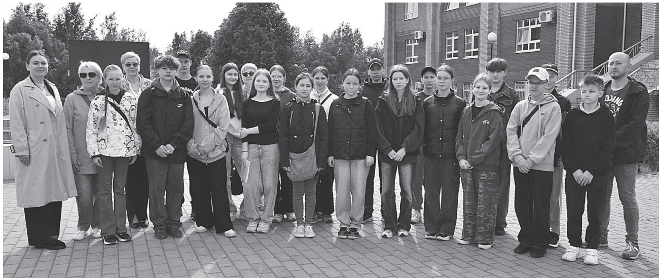
Участники торжественной линейки «Путёвка в трудовое лето».