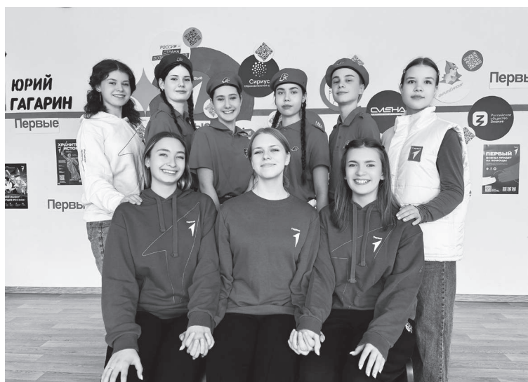
Активисты Движения Первых.

лонтёрами, актёрами театра и кино, а также другими интересными личностями.