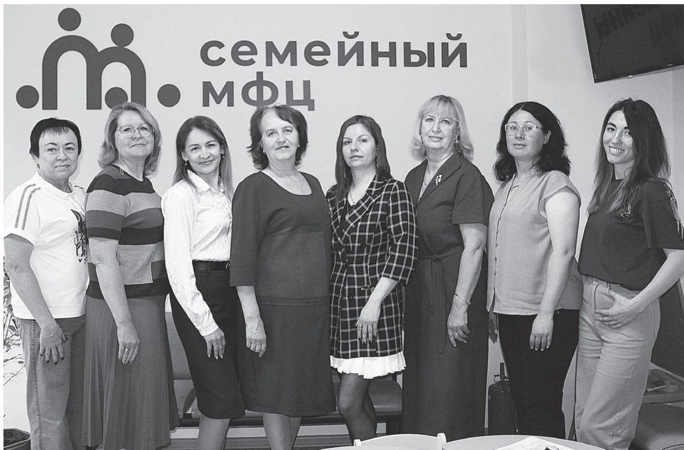
Коллектив отдела социальной защиты населения по ЗАТО г. Радужный.

Если наши возможности бывают ограничены, мы пользуемся базой владимирских учреждений социального обслуживания. Это Владимирский социально-реабилитационный центр для несовершенно-