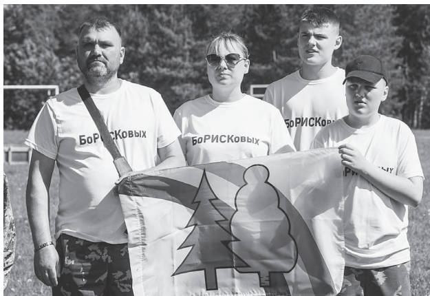
Семья Борисковых достойно представила Радужный на региональном этапе «Семейной зарницы».

Е. Н. Ромашечкина, председатель местного отделения Движения Первых.