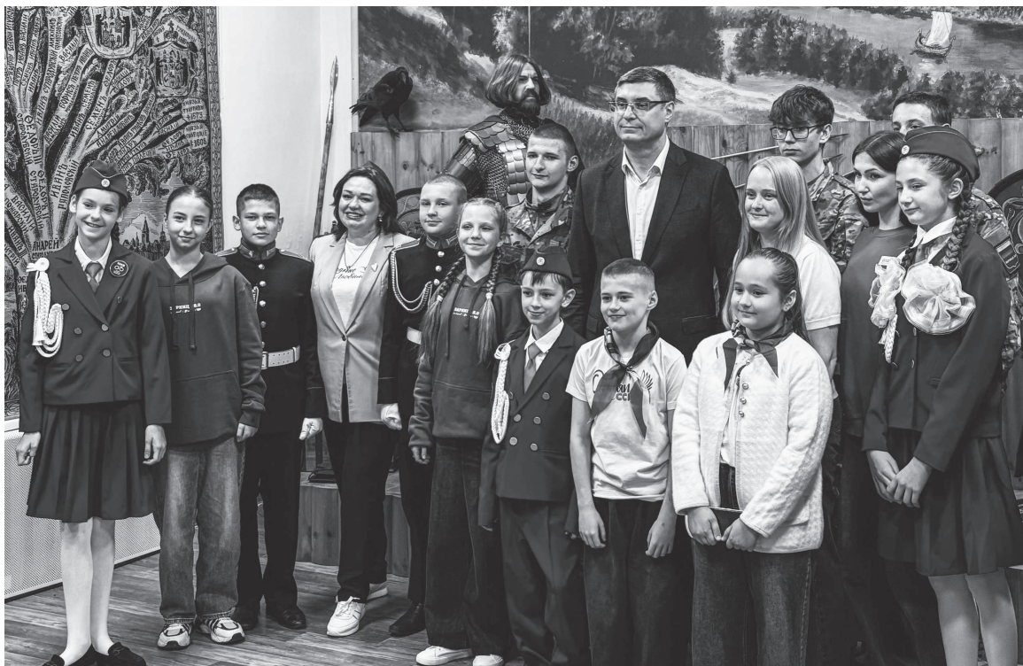
Губернатор Владимирской области Александр Авдеев на встрече с активистами Движения Первых.

Управление образования.