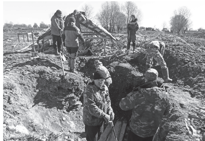
Поисковики на месте раскопа.