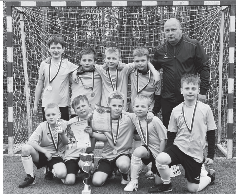
Команда «Кристалл» (г. Радужный) - победитель турнира.

Администрация ДЮСШ.