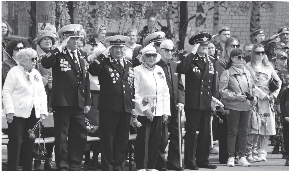
Равнение на Победу!

У этого праздника много своих традиций, одна из них появилась не так давно, но сразу прижилась, как будто была всегда - традиция носить георгиевскую ленточку. Черно-оранжевая лента - символ уважения к доблести, воинской славе и памяти о подвиге советских солдат, которые совершили невозможное - остановили распространение фашизма.