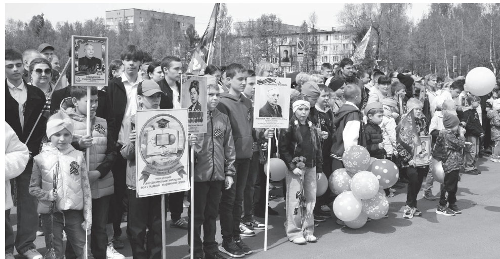
Юное поколение на митинге в честь праздника Победы.