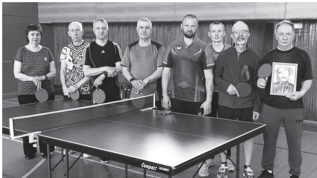
На открытии летнего сезона для любителей игры в настольный теннис.