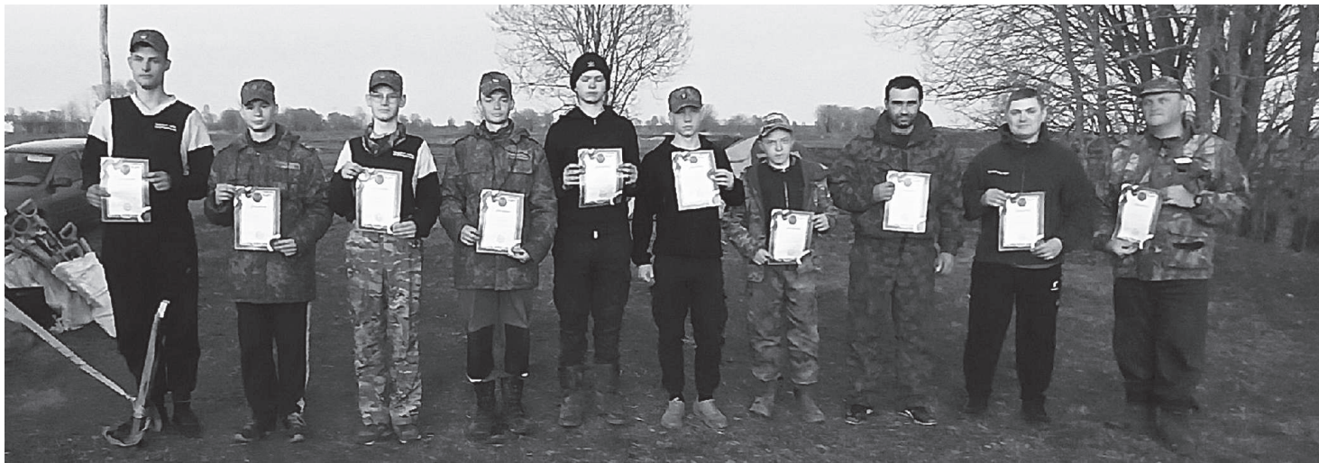
Участники Вахты памяти в Ленинградской области.