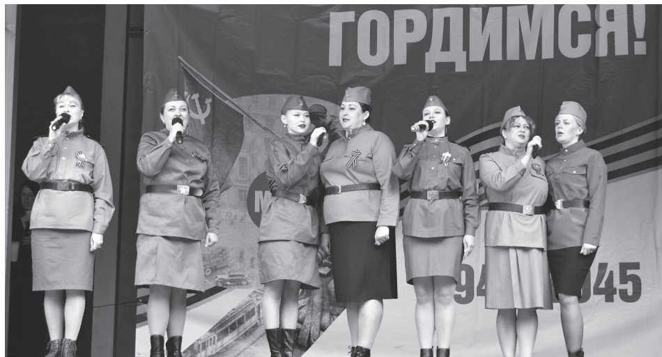
Участники вокальной студии «Пилигрим».