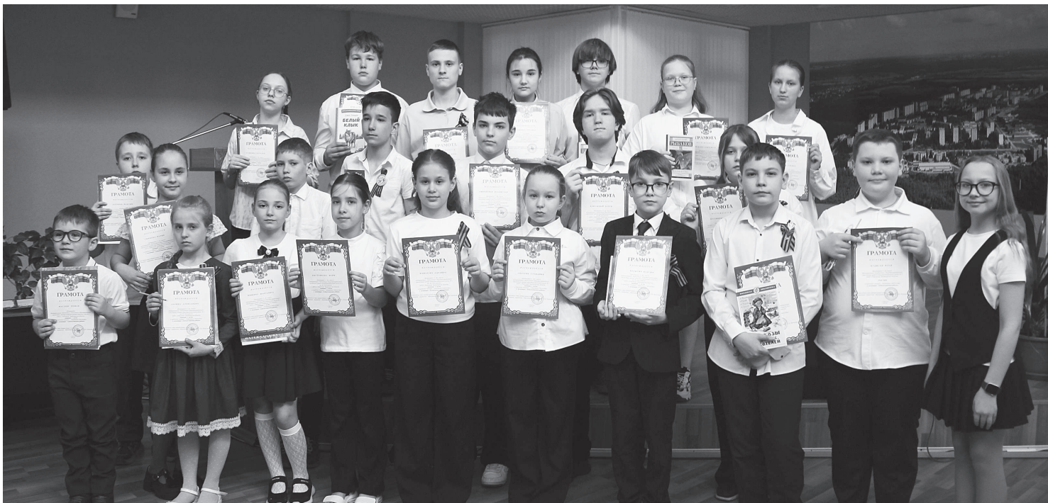
Победители и призёры городского конкурса творческих работ «Защитники Отечества».

Детские рисунки, представленные на конкурс, являлись лучшими иллюстрациями этой истории. Вот подводная лодка всплывает из морских глубин - это, наверное, по рассказам деда, военного моряка-подводника, каких в Радужном очень много. А вот нарисованы вязаные носочки, солдатские письма, конфетки - и сразу всё понятно. Этой семье близка волонтерская работа. Наверняка кто-то из близких вяжет сети, носки, собирает посылки нашим бойцам и пишет письма. А вот на рисунках воин в форме обнимает ребёнка - и сразу щемит сердце, возможно, в этой семье