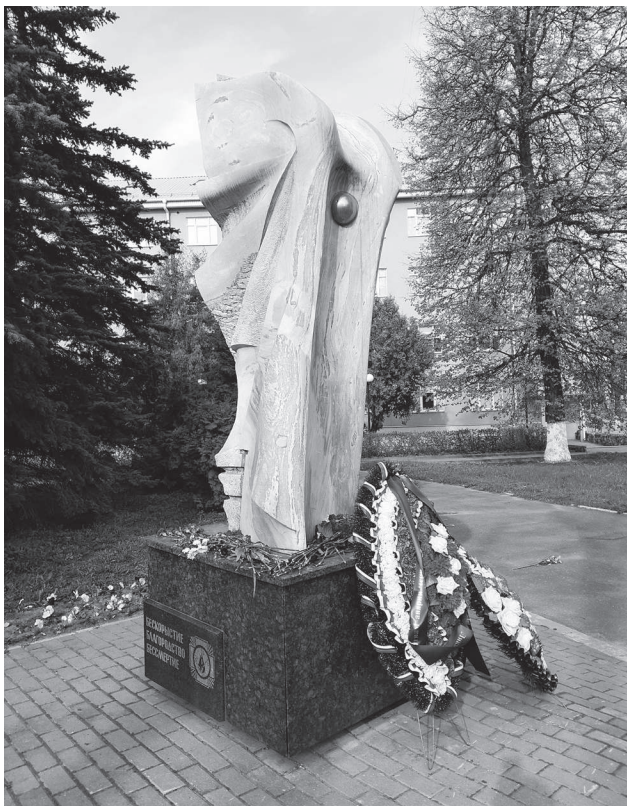
Монумент «Крылья», посвящённый героям-ликвидаторам аварии на ЧАЭС.

Чернобыльская АЭС была расположена на территории Украинской ССР, в 18 километрах от города Чернобыля, в 150 километрах от Киева и в 16 километрах от границы Беларуси. В 1970 году в трех километрах от ЧАЭС для работников станции и членов их семей был построен город Припять, который стал впоследствии символом катастрофы.