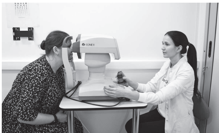
Приём у офтальмолога.

По заявкам в передвижных центрах здоровья проводятся комплексные обследования сотрудников предприятий, осуществляются специальные выезды для представителей общественных организаций, педагогических коллективов. Особое внимание уделяется обеспечению здоровья подрастающего поколения. В рамках проекта прием ведут детские врачи, проводятся комплексные обследования учащихся образовательных учреждений.