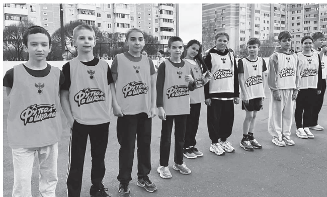
«Вызов Первых» показал: современная молодежь выбирает здоровый образ жизни, спортивный дух, командную сплочённость и волю к победе.

«Вызов Первых» показал: современная молодежь выбирает