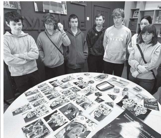
Экспонаты выставки вызвали большой интерес.