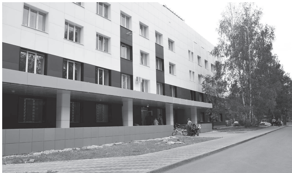
В этом году Городской больнице исполняется 45 лет.