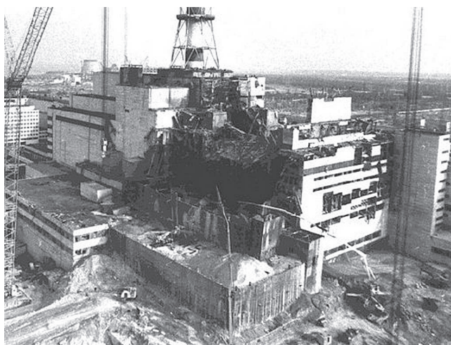
Разрушенный реактор ЧАЭС.