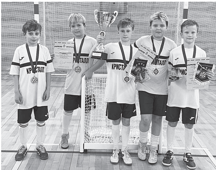
Команда «Кристалл» будет представлять наш регион на Первенстве России по микрофутзалу.

Комитет по культуре и спорту. Фото предоставлено автором.