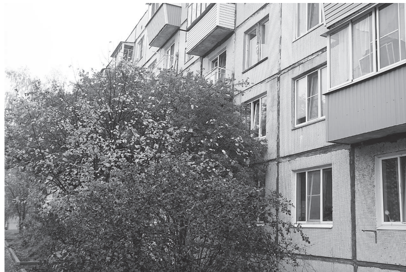
В городе много деревьев, произрастающих у домов.