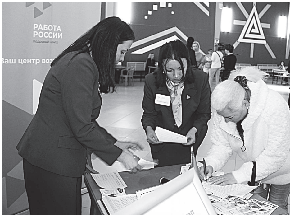
Специалисты Кадрового Центра «Работа России» в ходе ярмарки проводили консультации с гражданами, ищущими работу.

- Очень много вакансий, огромный дефицит специалистов в здравоохранении, образовании, коммунальной сфере, предприятиях городской инфраструктуры. А желающих трудоустроиться нет, - подчеркнул он.