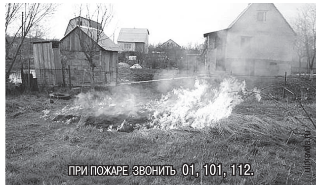
ПРИ ПОЖАРЕ ЗВОНИТЬ 01, 101, 112.