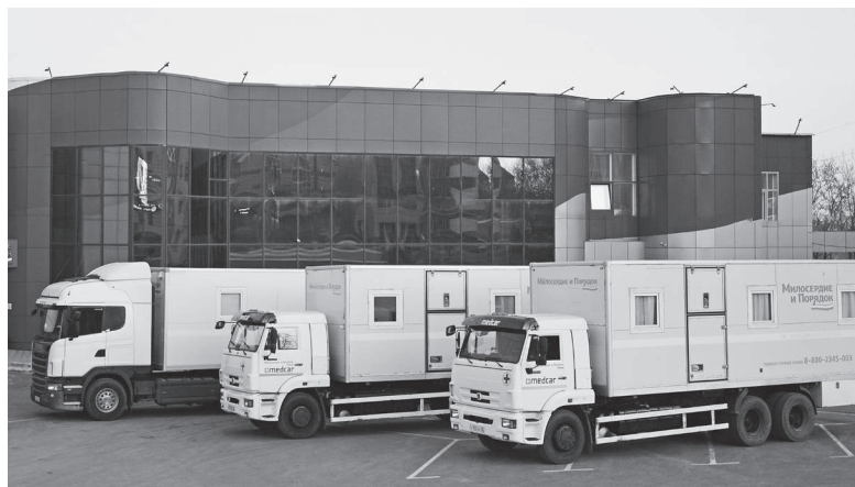
Передвижные медицинские комплексы.

Сбережение и укрепление здоровья россиян – приоритетное направление государственной политики, ключ к достижению национальных целей развития. Об этом говорит наш Президент Владимир Владимирович Путин. Проект «Передвижные центры здоровья» реализуется во Владимирской области уже более 10 лет. Он доказал свою востребованность и эффективность. Здоровье людей напрямую связано с качественной, своевременной и доступной медицинской помощью. Вовремя проведенное обследование и консультация грамотного специалиста – залог раннего выявления заболеваний и успешного лечения. Поэтому