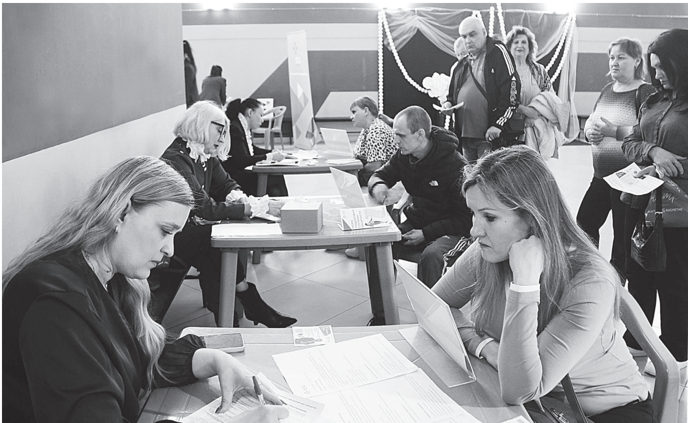
В ярмарке трудоустройства приняли участие 42 радужанина, ищущих работу, 20 студентов из технологического колледжа, два ветерана боевых действий, двое членов семей действующих участников СВО и 8 работодателей.