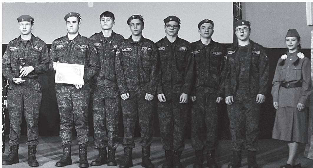
Команда «Лидеры Движения» СОШ №2.

За 1-е место - команде Кадетского корпуса «Пожарские», за 2-е место - команде «Лидеры Движения» СОШ №2, и за 3-е место - команде «Доблесть Первых» СОШ №1.