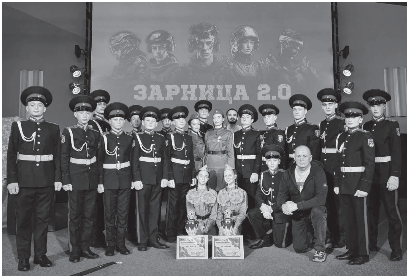
Команда «Пожарские» - победитель муниципального этапа Всероссийской военно-патриотической игры «Зарница 2.0».