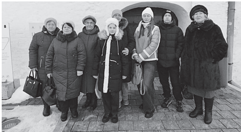
Члены семей участников специальной военной операции на экскурсии в Суздале.

- Всё было организовано на высшем уровне, в музее нас встретили очень душевно. Экскурсовод провел по двум залам, в доступной и интересной форме объяснил значение терминов «тени», «светотени», «работа на пленере», рассказал о том, что вдохновляло