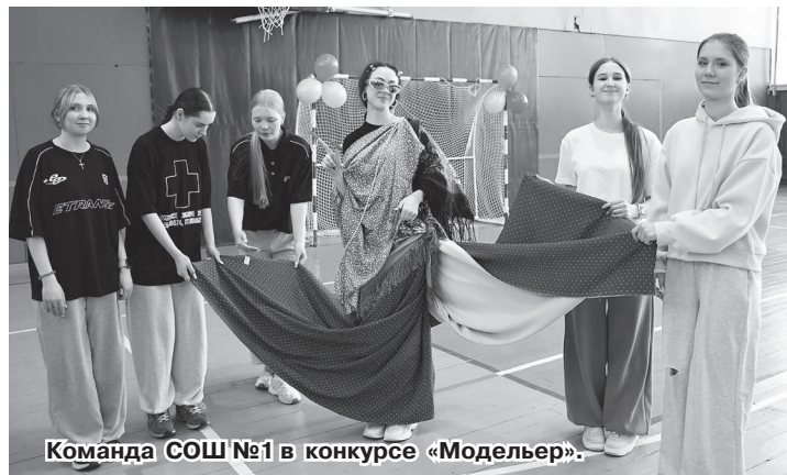
Команда СОШ №1 в конкурсе «Модельер».