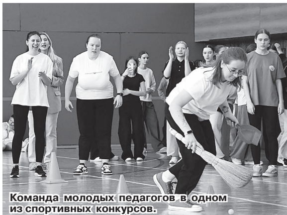
Команда молодых педагогов в одном из спортивных конкурсов.