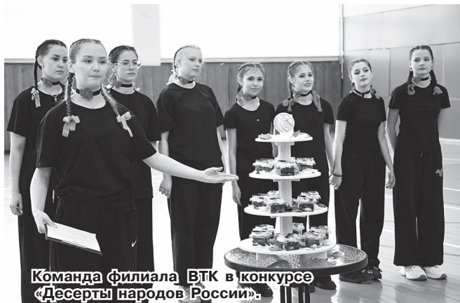
Команда филиала ВТК в конкурсе «Десерты народов России».