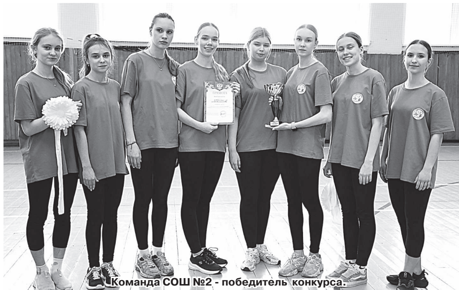
Команда СОШ №2 - победитель конкурса.

Отдел по молодежной политике управления образования.