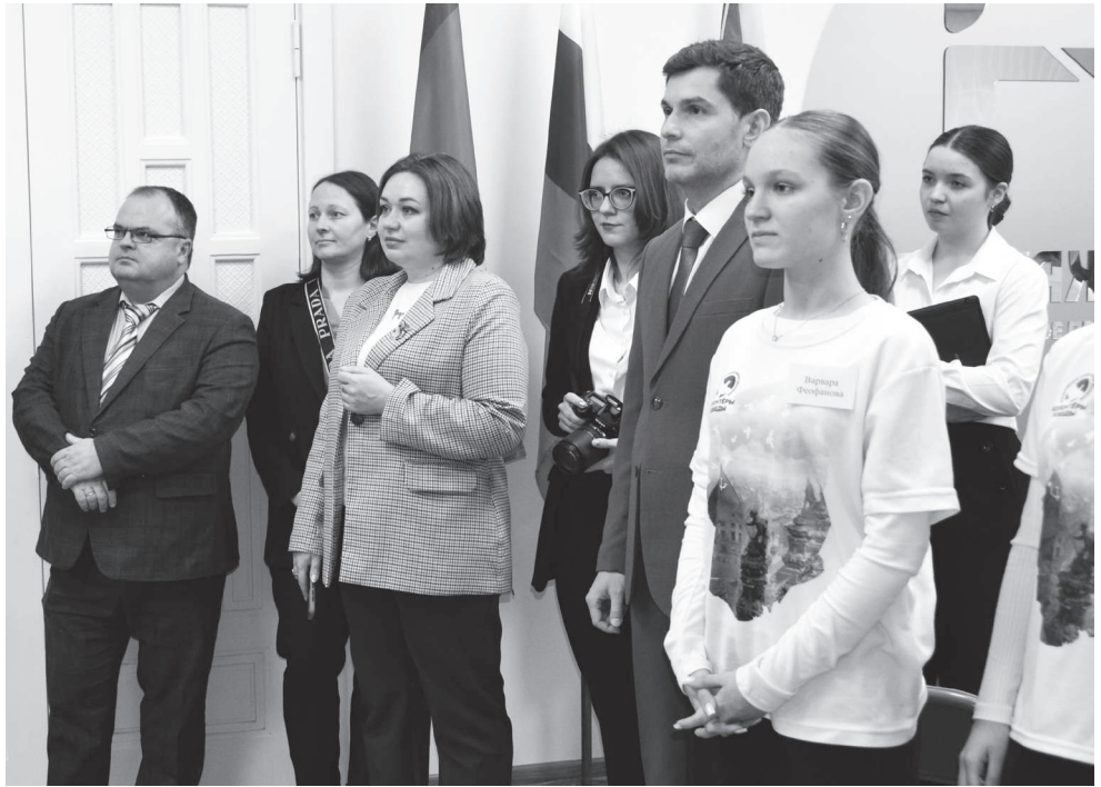
На открытии «Притяжения» было много почётных гостей и молодёжи.

Ребята представили гостям тематические зоны молодёжного пространства. Зал коворкинга позволяет проводить совместные мероприятия, интересные встречи, игры. Будет работать и оборудованная всем необходимым Медиа студия.