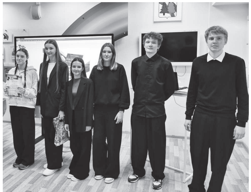
Команда СОШ №1 заняла второе место на конкурсе «Гражданином быть обязан».