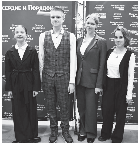
Стипендиаты из г. Радужного.