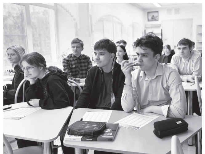
Вопросы заинтересовали учащихся.

Н.Н. Верзун, зам. директора по учебно-воспитательной работе МБОУ СОШ № 1.