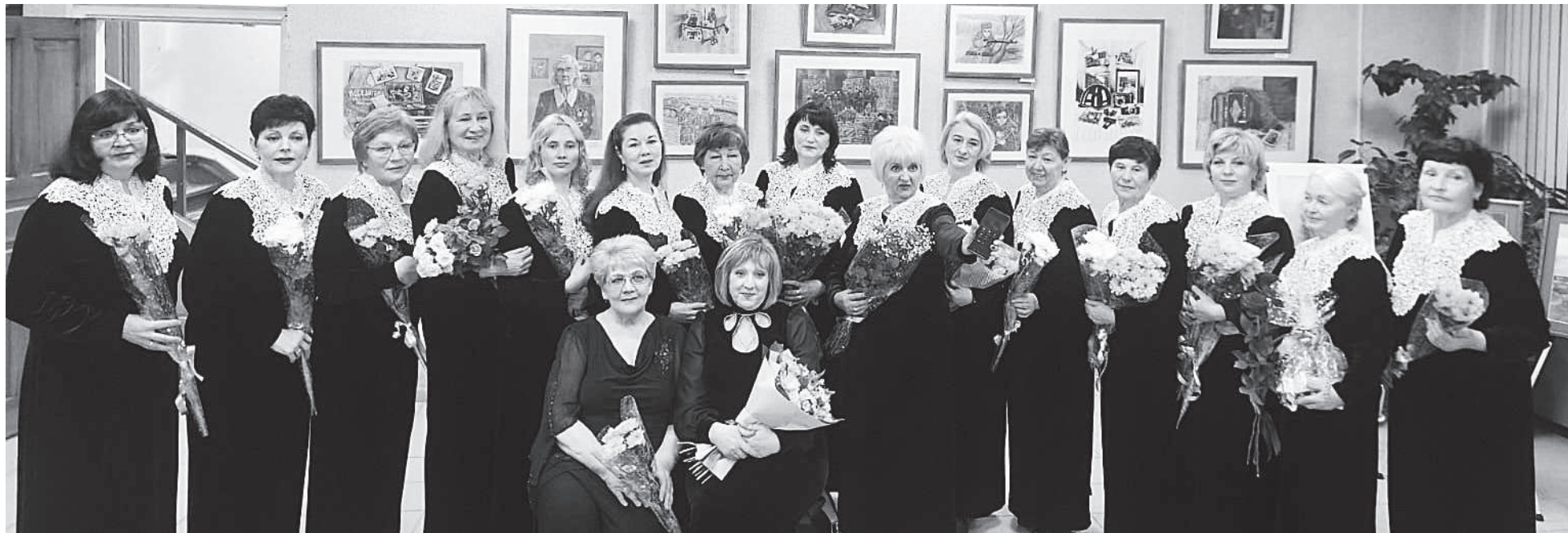
Хор «Вдохновение» в день концерта в честь своего 40-летия.