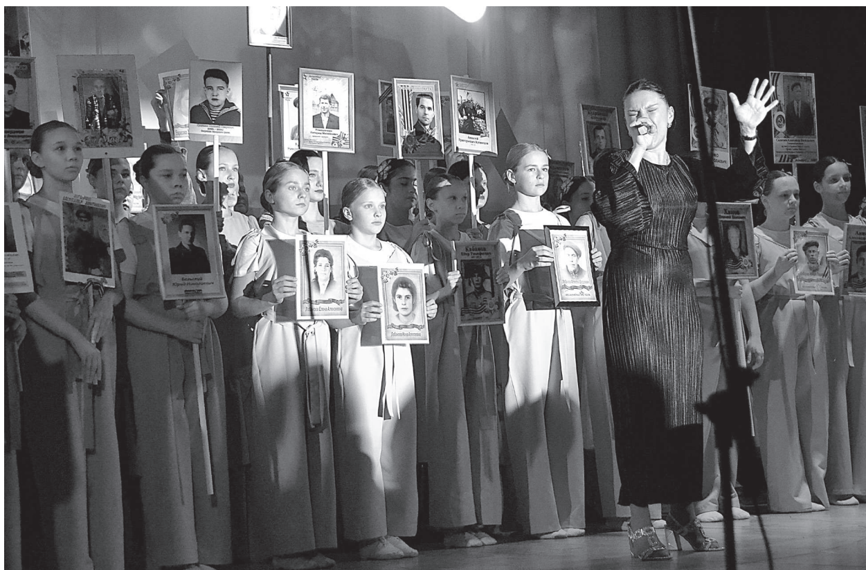
На открытии Недели культуры и спорта.