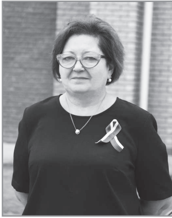
Е. Малиновская.

Ежегодная Неделя культуры и спорта, несомненно, масштабное культурное событие в нашем городе. Организаторы всегда стараются, чтобы она была насыщенной и запоминающейся, и рассчитана на зрителей разного возраста и на любой вкус. Приходите, будет интересно!