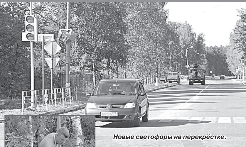
Новые светофоры на перекрёстке.

Светофоры установлены в Радужном на перекрёстке у многоквартирного дома №1 первого квартала. Это стало необходимо из-за возникновения напряжения на этом участке в утренние часы. Генеральным подрядчиком работ по обустройству перекрёстка является ООО «ТехСтройРесурс», г. Ковров. Установку знаков пешеходного перехода и нанесение разметки производит ООО «Дорзнак», г. Ковров.