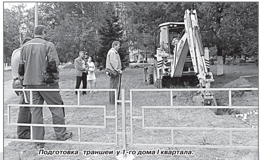
Подготовка траншеи у 1-го дома I квартала.