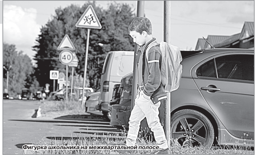
Фигурка школьника на межквартирной полосе.

В пятницу, 11 августа с узкой стороны межквартирной полосы было начато обновление покрытия пешеходных переходов. Также ко Дню знаний планируется обновить покрытие нарисованных на дорогах знаков «Осторожно, дети!». А во вторник, 15 августа около пешеходных переходов были установлены фигурки школьников, призванные повысить бдительность автомобилистов.