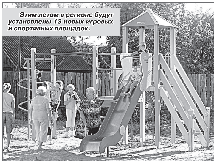
Этим летом в регионе будут установлены 13 новых игровых и спортивных площадок.

Во Владимирской области продолжается реализация долгосрочного проекта депутата Госдумы Григория Викторовича Аникеева «Дворы для детворы». По его инициативе в регионе этим летом будут установлены 13 новых игровых и спортивных площадок.