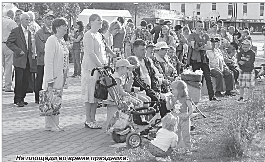
На площади во время праздника.