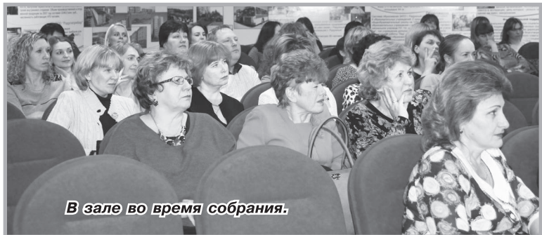
В зале во время собрания.