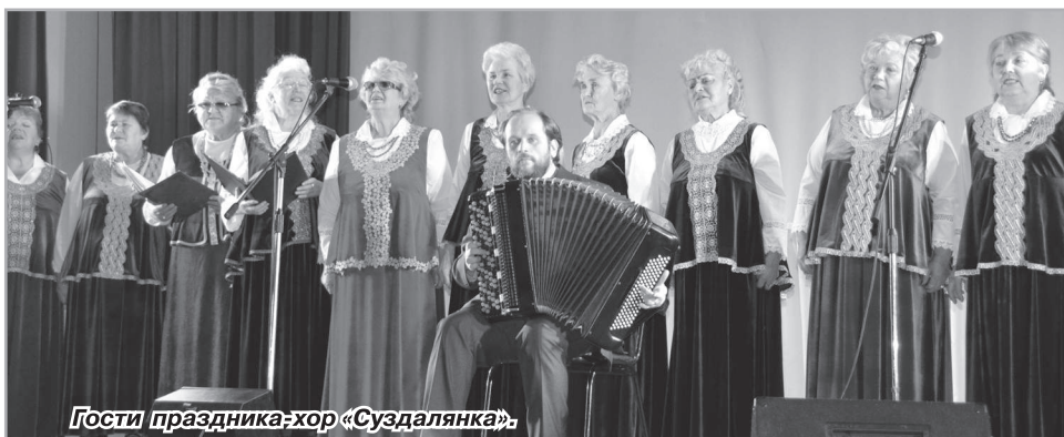
Гости праздника: хор «Суздалянка».