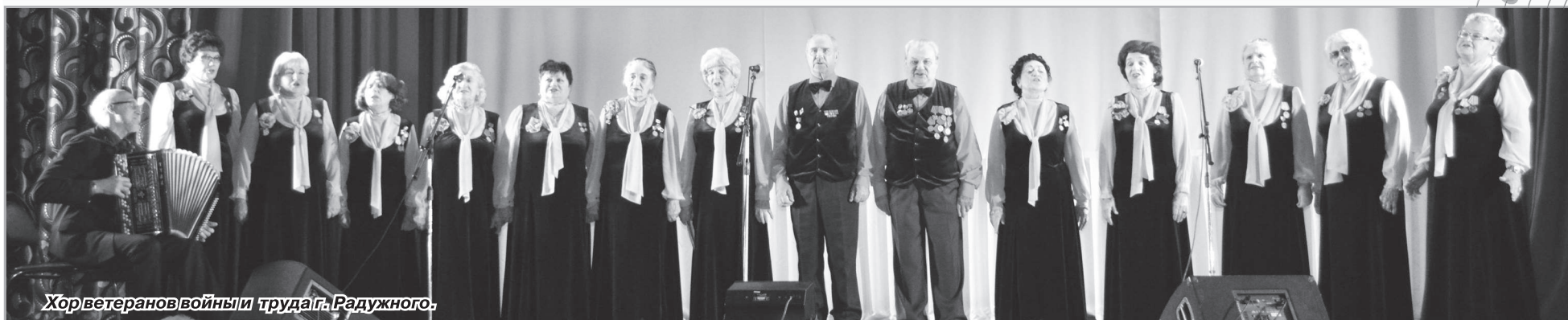
Хор ветеранов войны и труда г. Радужного.

Во вторник, 21 ноября в Культурном центре «Досуг» в творческом соперничестве сошлись хоры ветеранов войны и труда Радужного и Суздаля.