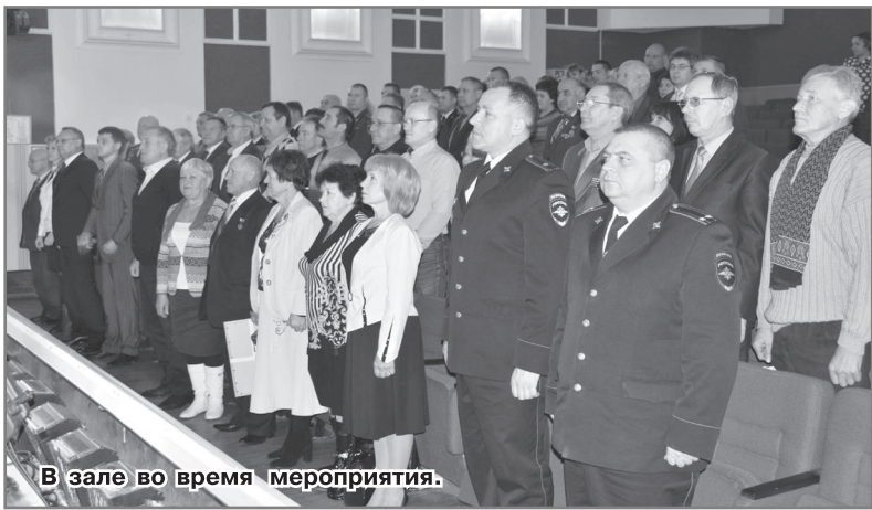
В зале во время мероприятия.