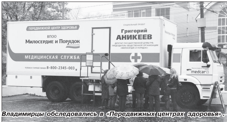
Владимирцы обследовались в «Передвижных центрах здоровья».

«Принципиально важно, чтобы как можно больше людей смогли получить бесплатные консультации врачей и пройти обследование».