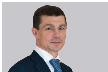
Максим Топилин, Министр труда и социальной защиты Российской Федерации

«Министерство труда и социальной защиты Российской Федерации всецело поддерживает инициативы по развитию отечественного рынка СИЗ, импортозамещению, повышению качества выпускаемой и потребляемой продукции. Важно, что выставка SAPE дает возможность услышать мнения всех участников процесса – от производителей до конечных потребителей».