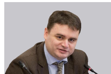
Василий Осьмаков, Заместитель министра промышленности и торговли Российской Федерации

«Выставка SAPE – та площадка, где представлены прогрессивные решения и инновационные технологии по обеспечению безопасных условий в сфере охраны труда. Лучшие технологии и разработки в области СИЗ, успешные проекты и практики, показательные учения, мнения экспертов и рекомендации потребителей – все это мощные стимулы для дальнейшего гарантирования безопасности на рабочих местах».