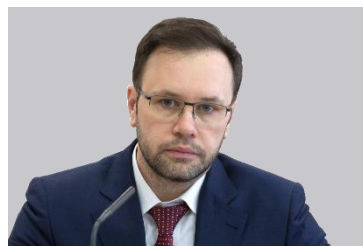
Григорий Лекарев, Заместитель министра труда и социальной защиты Российской Федерации

«Министерство труда и социальной защиты Российской Федерации всецело поддерживает инициативы по развитию отечественного рынка СИЗ, импортозамещению, повышению качества выпускаемой и потребляемой продукции. Важно, что выставка SAPE дает возможность услышать мнения всех участников процесса – от производителей до конечных потребителей».