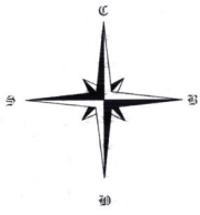
Схема планировки территории 7/2 квартала Благодар ЗАТО г.Радужный Владимирской области для комплексного освоения в целях жилищного строительства

Утверждено постановлением Администрации ЗАТО г.Радужный Владимирской области от 14.04.2019 № 526