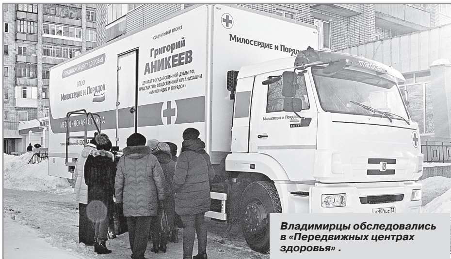
Владимирцы обследовались в «Передвижных центрах здоровья».

Ознакомиться с графиком работы «Передвижных центров здоровья» можно на официальном сайте общественной организации «Милосердие и порядок» ( vproo-mir.ru ) и в группах в социальных сетях. Записаться к врачу можно заранее по телефону бесплатной горячей линии: 8 (800) 2345 003.