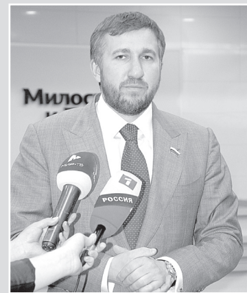
Депутат Государственной Думы РФ Григорий Аникеев:

«Передвижные центры здоровья» работают по записи, чтобы людям можно было выбрать удобное время для посещения специалиста. Прием ведут кардиолог, отоларинголог, эндокринолог, офтальмолог, невролог, маммолог, гинеколог и хирург.