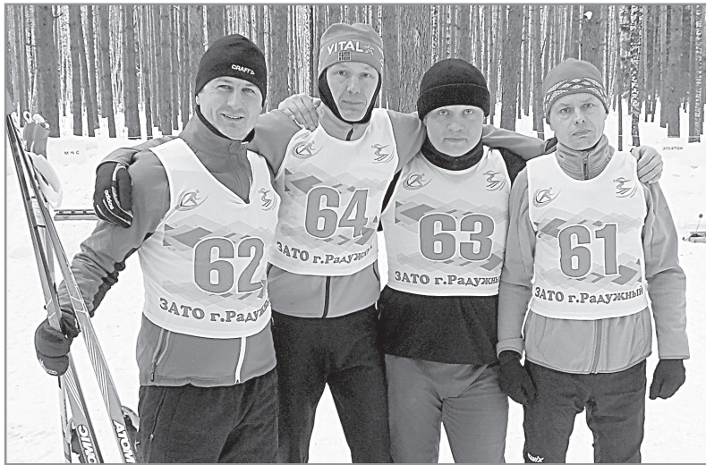
На фото: команда «Электрон».