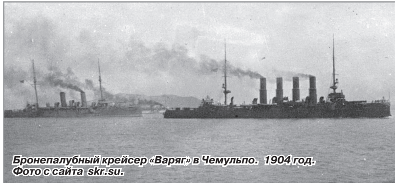
Бронепалубный крейсер «Варяг» в Чемульпо. 1904 год.

9 февраля — памятная дата военной истории России. В этот день в 1904 году российский крейсер «Варяг» и канонерская лодка «Кореец» в неравном бою героически сражались с японской эскадрой в корейской бухте Чемульпо.