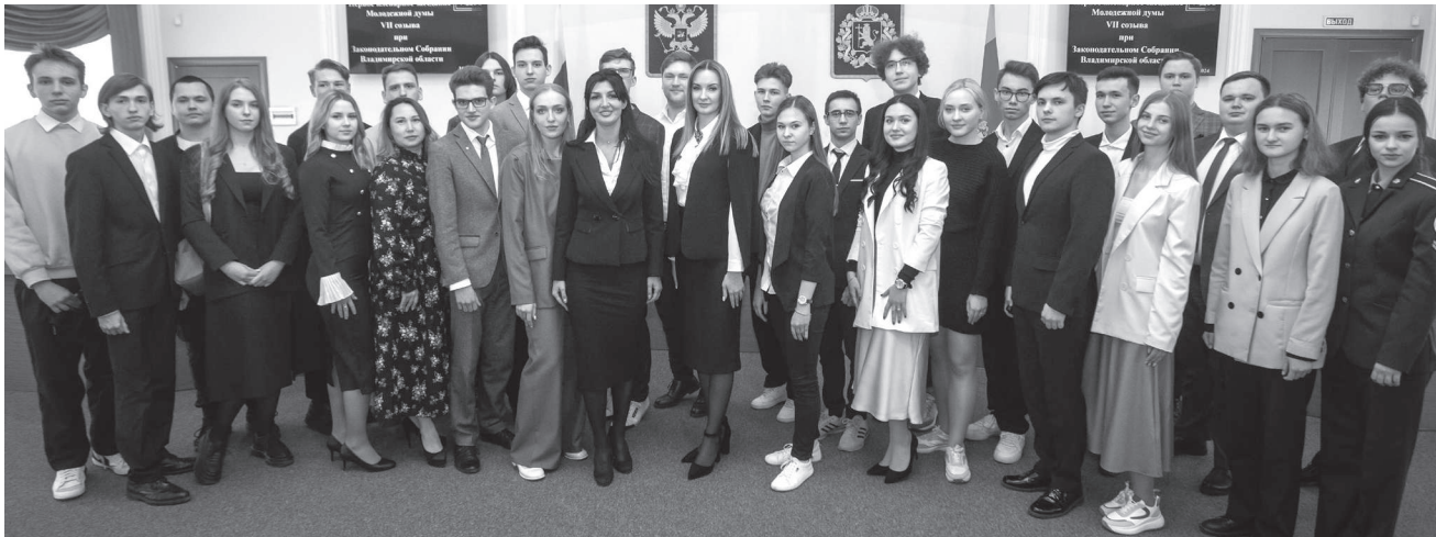
Материал подготовлен пресс-службой ЗС Владимирской области.

В копилке Молодежной думы проведение молодежного парламентского Саммита ЦФО «Политический рубеж», реализация проектов «Экофронт», «Педагог и наставник», «Доноры, на Старт», просветительской акции Урок России «Вчера. Сегодня. Завтра», фотовыставки «Молодые ученые – будущее России». Многие члены предыдущих составов стали сотрудниками Законодательного собрания, различных федеральных и региональных структур, помощниками депутатов различных уровней.