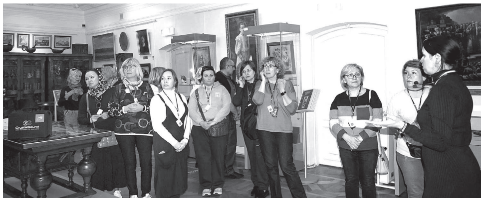
Управление массовых коммуникаций администрации Владимирской области.

Приобретенное оборудование улучшит качество проведения экскурсий в небольших залах музея, а также даст возможность принимать большее количество туристов одновременно. А новый сенсорный стол с мультимедийным контентом, расположенный в экспозиции, в игровой форме представит гостям самые интересные факты и фрагменты жизни Петра и Февронии Муромских. Работники музея уверены, что теперь посещение музея станет более интересным для посетителей с детьми.