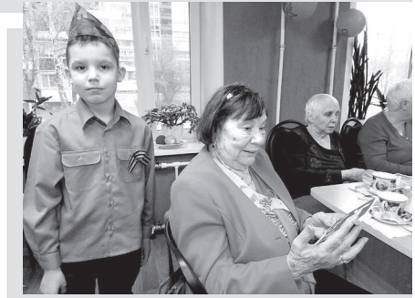
Филиал Владимирского КЦСОН в г. Радужном.