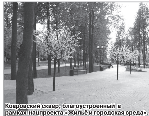
Ковровский сквер, благоустроенный в рамках нацпроекта «Жильё и городская среда».

крупных инвестиционных проектов. Среди них – проекты АО «ПО «Муроммашзавод», ООО «Вайлдберриз», ООО «Лузалес-Владимир», ООО «Точмаш-авто», ООО «Николь-ПАК Империял», АО «Элиттекс», ООО НПО «Камешковский радиоэлектронный завод».