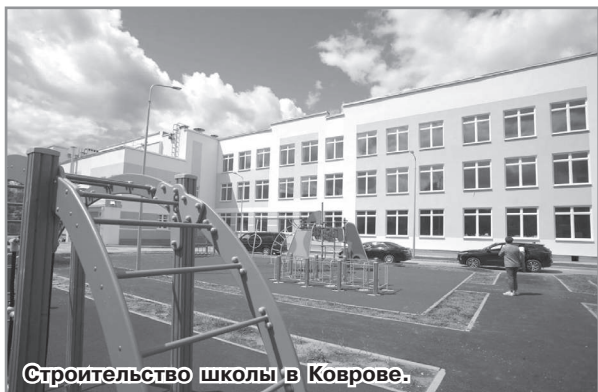
Строительство школы в Коврове.