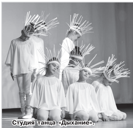
Студия танца «Дыхание».

Ежегодно у главного конкурсного этапа фестиваля «Визитной карточки» есть определённая тема. Указом Президента РФ 2024 год объявлен Годом семьи, поэтому визитную карточку организаторы предложили назвать «Танцуем по-семейному».