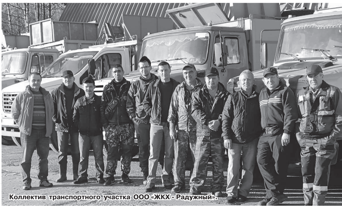
Коллектив транспортного участка ООО «ЖКХ - Радужный».