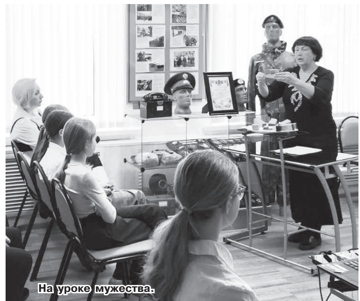
На уроке мужества.

Администрация ЦВР «Лад». Фото предоставлено автором.