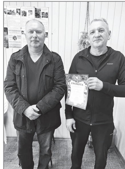
Комитет по культуре и спорту. На фото: команда «Электон».

Следующий вид в программе городской спартакиады среди предприятий и учреждений г. Радужного – плавательная эстафета. Она пройдёт на базе бассейна ДЮСШ ориентировочно 6-7 апреля.