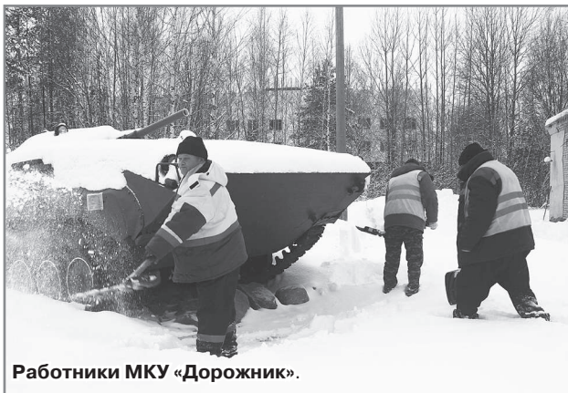
Работники МКУ «Дорожник».