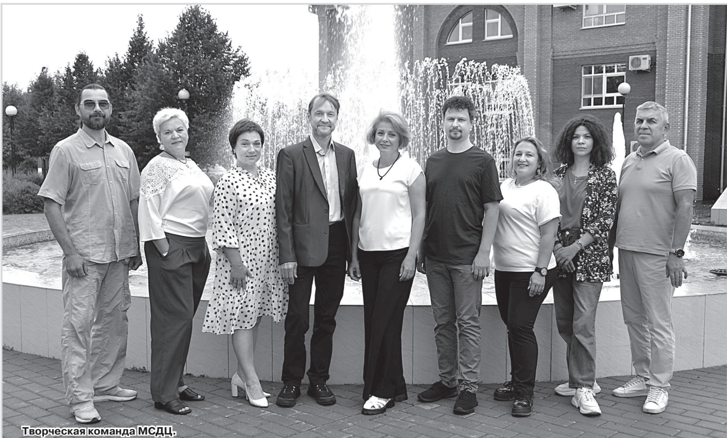
Творческая команда МСДЦ.